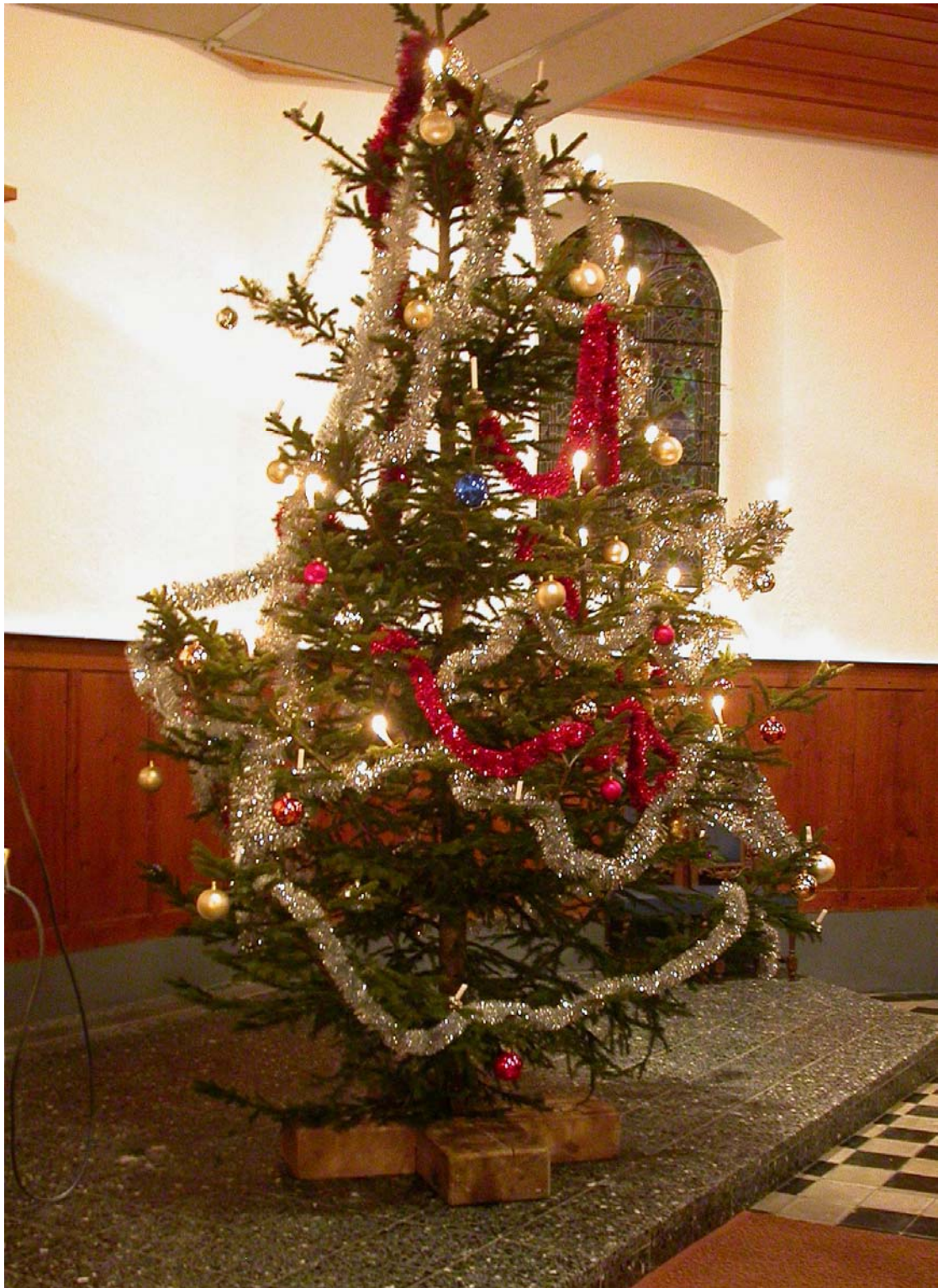
Mon beau sapin...