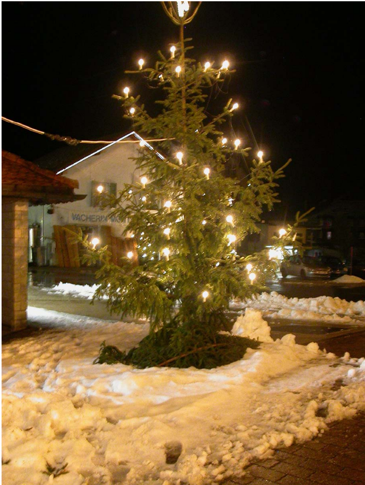
Un arbre de Noël illumine désormais les abords de l'église.