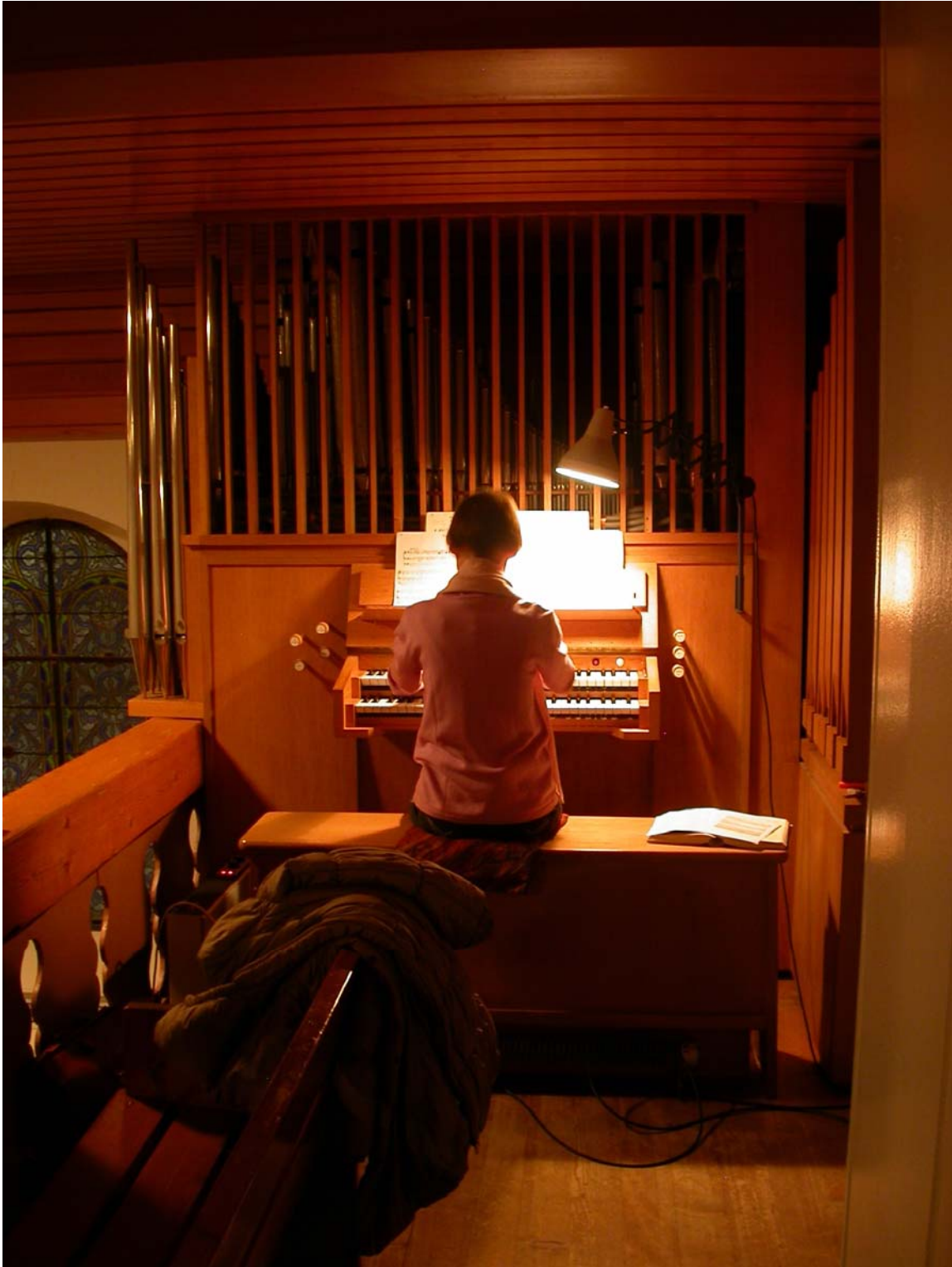
Notre immuable organiste, indispensable pour ces chants de Noël que l'on chante à gorge déployée !