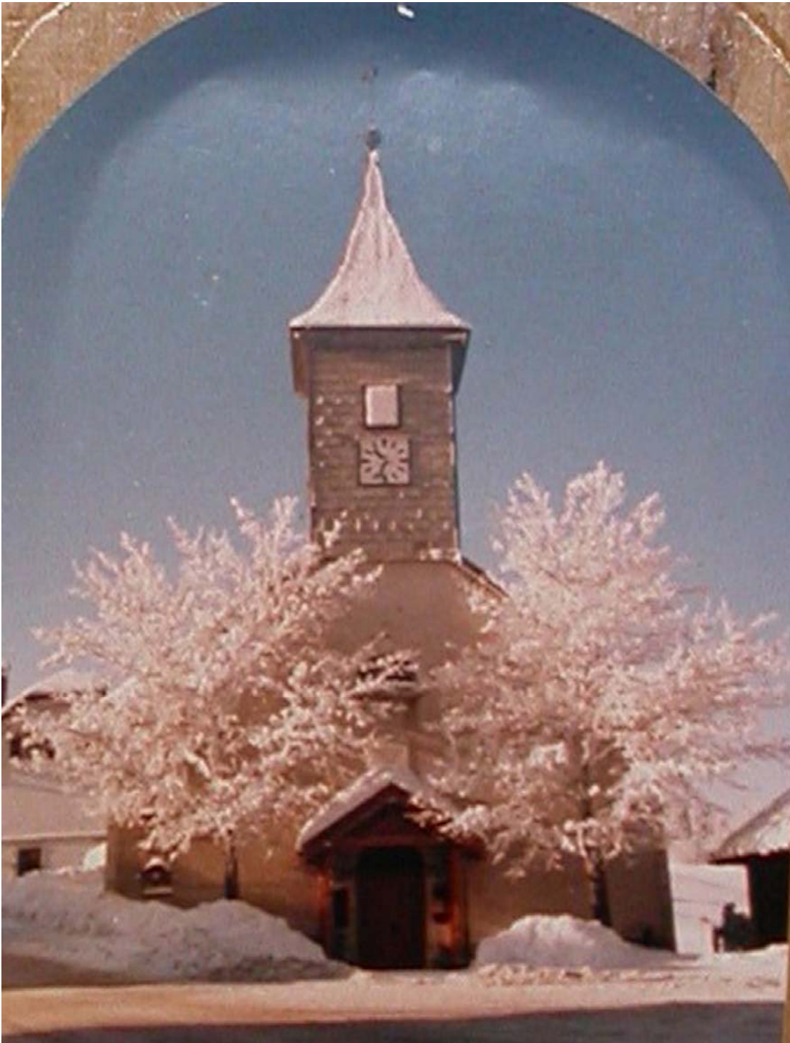
L'église des charbonnières vers 1970-1980 par une belle journée d'hiver.